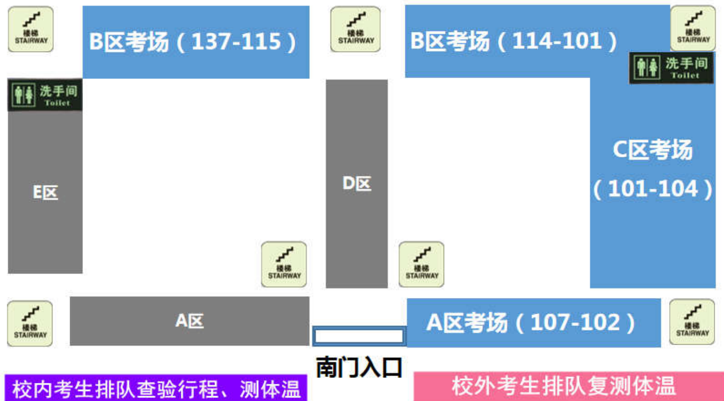
南京农业大学卫岗校区教学楼平面示意图 ( ■ 区域为考场区 )